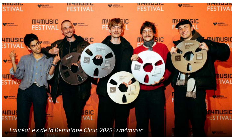
Lauréat·e-s de la Demotape Clinic 2025