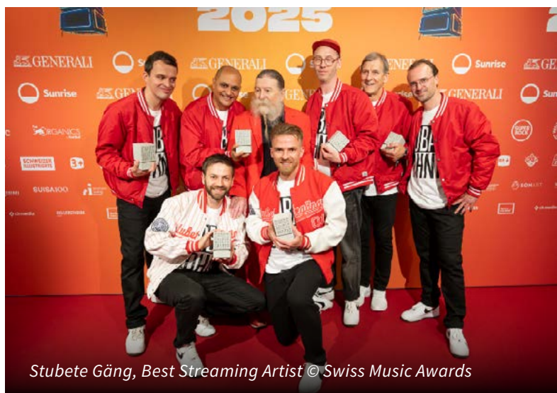
Stubete Gäng, Best Streaming Artist

Plus d'informations : → swissmusicawards.ch