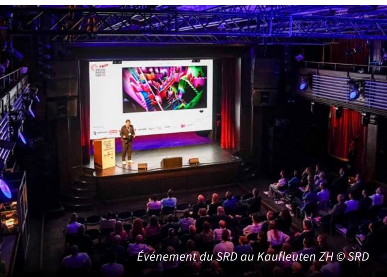
Événement du SRD au Kaufleuten ZH

Partenaire de longue date, SWISSPERFORM continuera à soutenir le SwissRadioDay afin de rendre les innovations visibles et de renforcer la diversité du paysage radiophonique suisse.