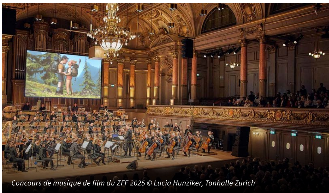
Concours de musique de film du ZFF 2025 © Lucia Hunziker, Tonhalle Zurich

La Fondation culturelle pour l'audiovisuel en Suisse soutient la Compétition internationale de musique de film pour la 11 e fois.