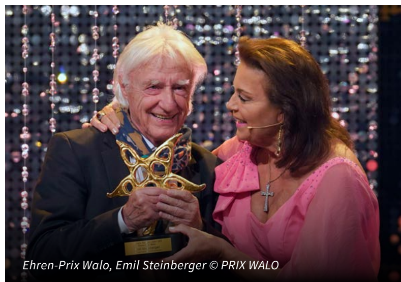
Ehren-Prix Walo, Emil Steinberger