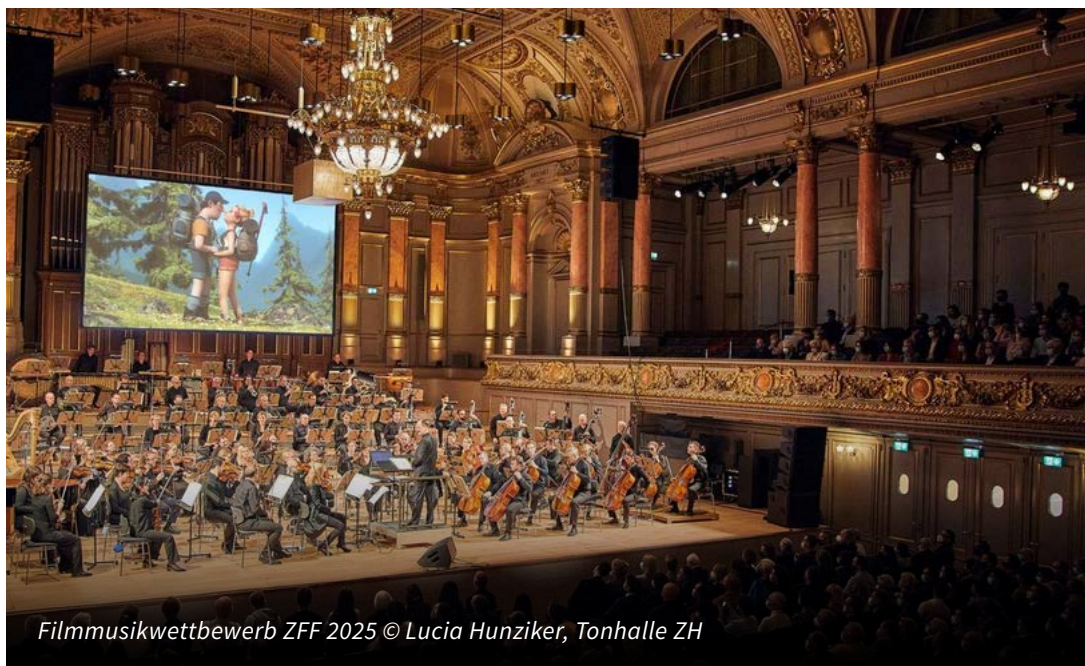
Filmmusikwettbewerb ZFF 2025

Die Schweizerische Kulturstiftung für Audiovision unterstützte den Wettbewerb bereits zum elften Mal.