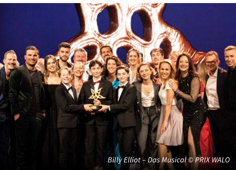
Billy Elliot – Das Musical

Die Gala bot einen umfassenden Einblick in das kreative Schaffen des vergangenen Jahres und zeigte eindrücklich die Vielfalt und Qualität der Schweizer Unterhaltungsszene. Als langjährige Partnerorganisation würdigt SWISSPERFORM die herausragenden Leistungen aller Nominierten und Preisträger*innen und unterstützt die Sichtbarkeit professioneller Kulturschaffender in der Schweiz.