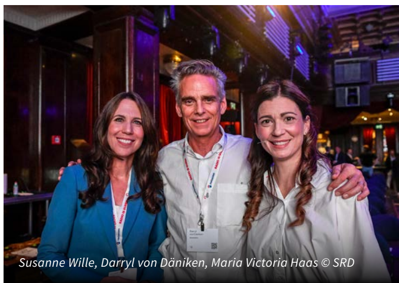
Susanne Wille, Darryl von Däniken, Maria Victoria Haas