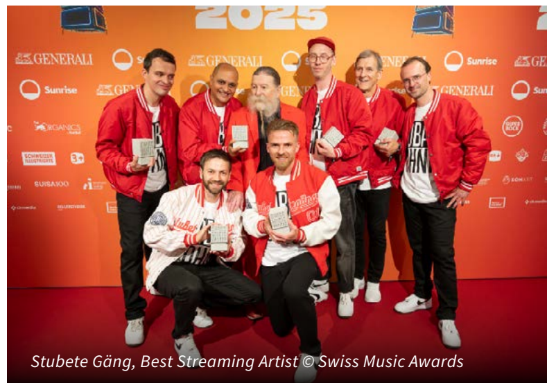
Stubete Gäng, Best Streaming Artist