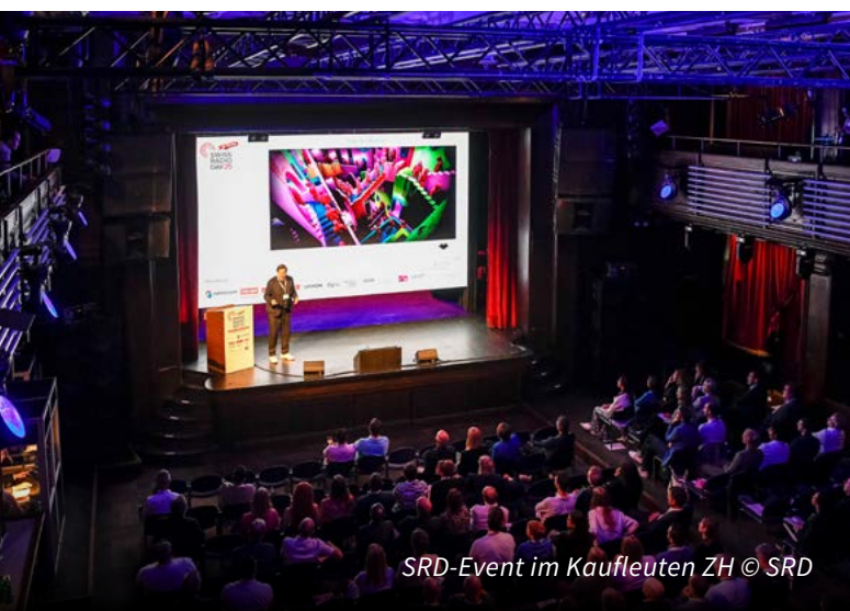
SRD-Event im Kaufleuten ZH

Als langjährige Partnerin unterstützt SWISSPERFORM den SwissRadioDay auch künftig dabei, Innovationen sichtbar zu machen und die Vielfalt des Schweizer Radios zu stärken.